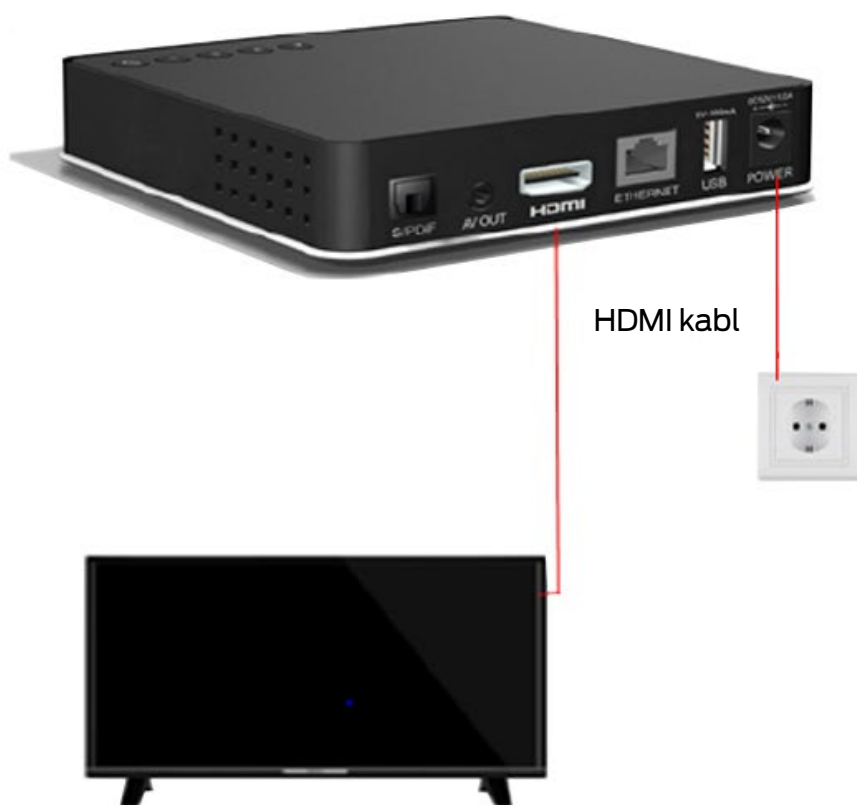
Slika 2. Povezivanje STB-a sa TV prijemnikom i napajanjem

STB uređaj je moguće povezati sa televizorom odgovarajućim kablom (HDMI i AV). Nakon povezivanja STB-a sa TV prijemnikom i ONT-om, potrebno je uključiti napajanje (Slika 2.). Ukoliko je sve u redu na prednjoj strani modema upaliće se zelene lampice (LAN 4, LAN 3, LAN 2, LAN 1) u zavisnosti od broja predviđenih STB-ova.