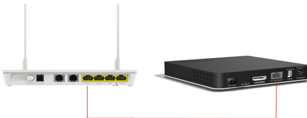
Slika 1. Povezivanje STB-a sa optičkim modemom

U slučaju dodavanja trećeg dodatnog STB uređaja mrežnim Ethernet kablom, iz pakovanja, povezuje se STB uređaj sa ONT-a, tako što jedan kraj mrežnog kabla postavimo u LAN 2 ulaz na modemu, a drugi kraj Ethernet kabla u odgovarajući izlaz na zadnjoj strani STB uređaja.