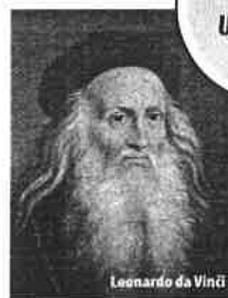
Leonardo da Vinci

Svaka osoba koja bude željela da se divi djelima umjetnika u galerijama "Luvra" moraće da rezerviše vrijeme posjete, naveli su iz muzeja